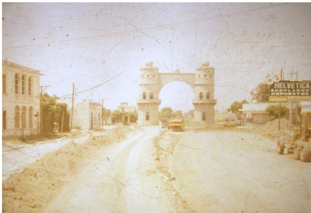
Diapositiva: Reformas realizadas en 1978 20

espacio 18 obligando a los vehículos pasar por los costados 19 , cerrando el paso por debajo del arco. Esto correspondía a unas series de cambios estructurales realizado por toda la ciudad, aprovechando la oportunidad de La Copa Mundial de Fútbol que se llevaría a cabo, entre el 1 y 25 de junio del mencionado año. Por ello debía estar finalizado para las mencionadas fechas.