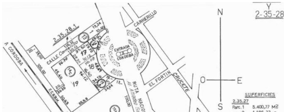
Plano parcelario fechado el 18 de enero de 1992 – Nomenclatura 02-35-027